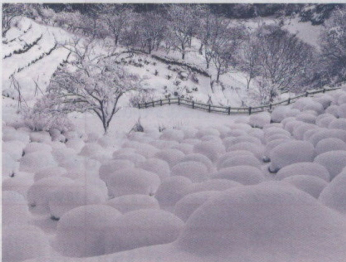
前回のグランプリ作品 「ツツジ園の珍景」 卯辰山公園 林 裕晃